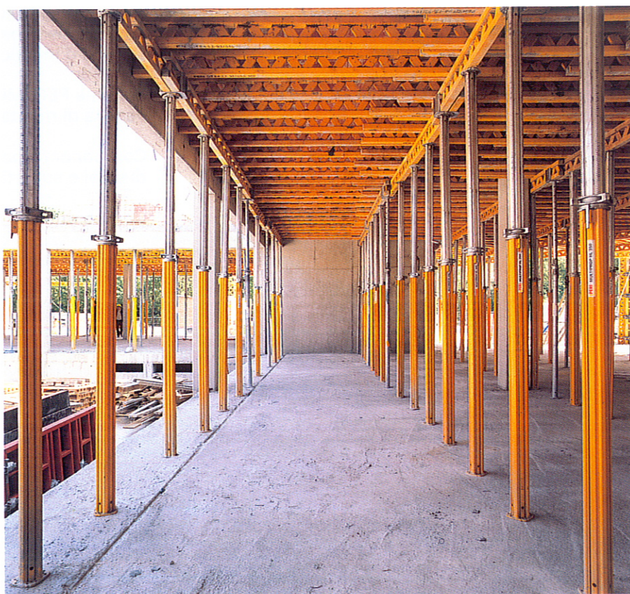
MULTIPROP 350 abbinato alla cassaforma a travi MULTIFLEX per solai.